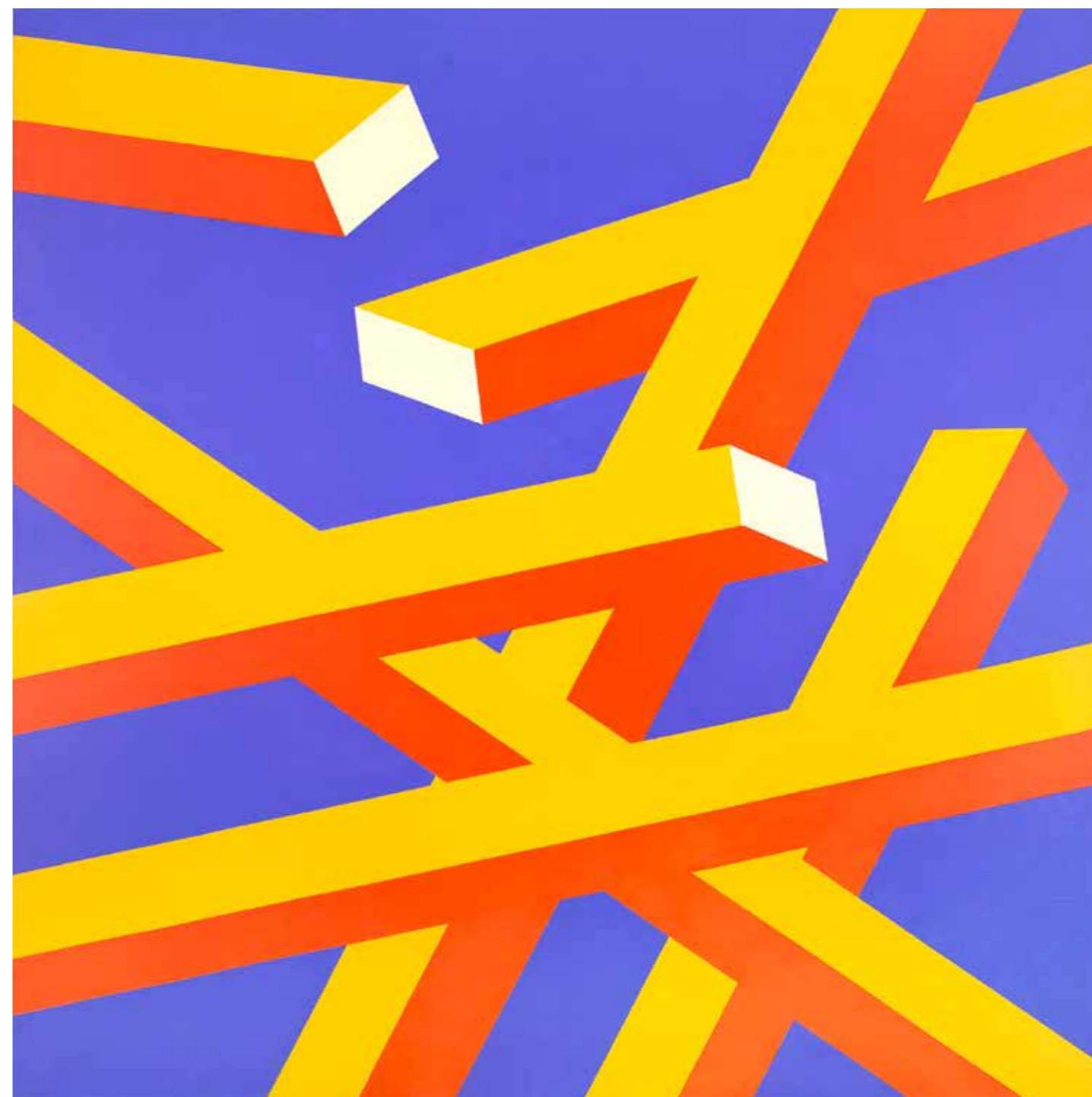
Aggressive Bewegung 2016, Acryl auf Leinwand, 150 × 150 cm

Aus: »Meine Geburt oder der Kampf verloren«