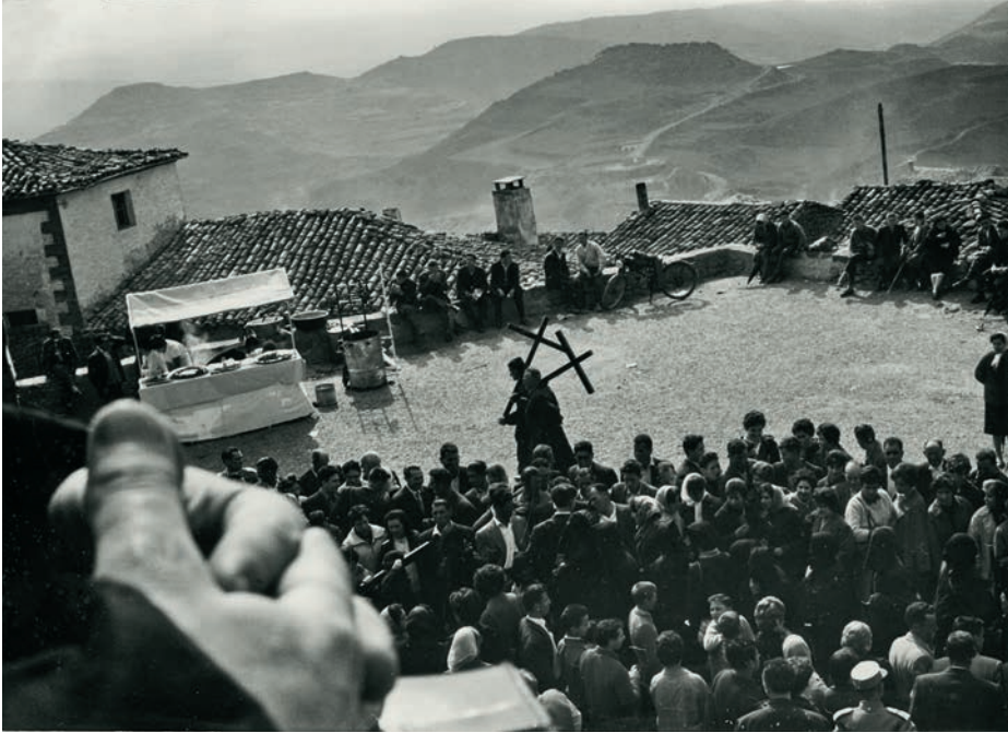
Unterwegs in Spanien

EE wird arbeiten, ich will ihm helfen oder einfach dabei sein. Arkady fasziniert mich auch, er hat viele gute Eigenschaften und ist ein eleganter Mann von Welt, kultiviert und mit guten Manieren. Aber ich fliege nach Europa, um meinen Meister zu treffen, einfach weil unsere Seelen nach einander verlangen. EE ist zwar verheiratet und hat vier Kinder, aber das bedeutet mir nichts, ich gehöre nicht zu seinem normalen Leben. Und diese kommenden zwei Wochen sind nichts anderes als zwei Wochen fern der bekannten Augen und Zungen. Nichts vorher und nichts nachher, dachte ich. Und was später kommt, wird bestimmt nicht gut. Also wozu jetzt daran denken.