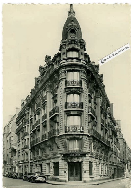
Postkarte. Hotel Cecil, Rue St. Didier / Rue Lauriston, Paris XVI, 1961