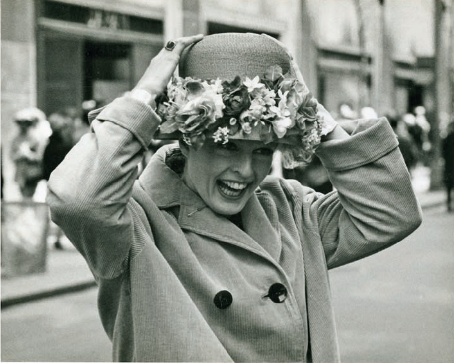
Easter Parade, New York

3. April, Telegramm von Sherman Fairchild. Brief an EE geschrieben. Palmers sind in Washington. Eine Stewardess von VARIG brachte mir meine Kleider aus Rio. Mit Fairchild in ‚Four Seasons‘ herrlich gegessen. Aber keine Photos in Sicht. Hoagy Carmichael getroffen.