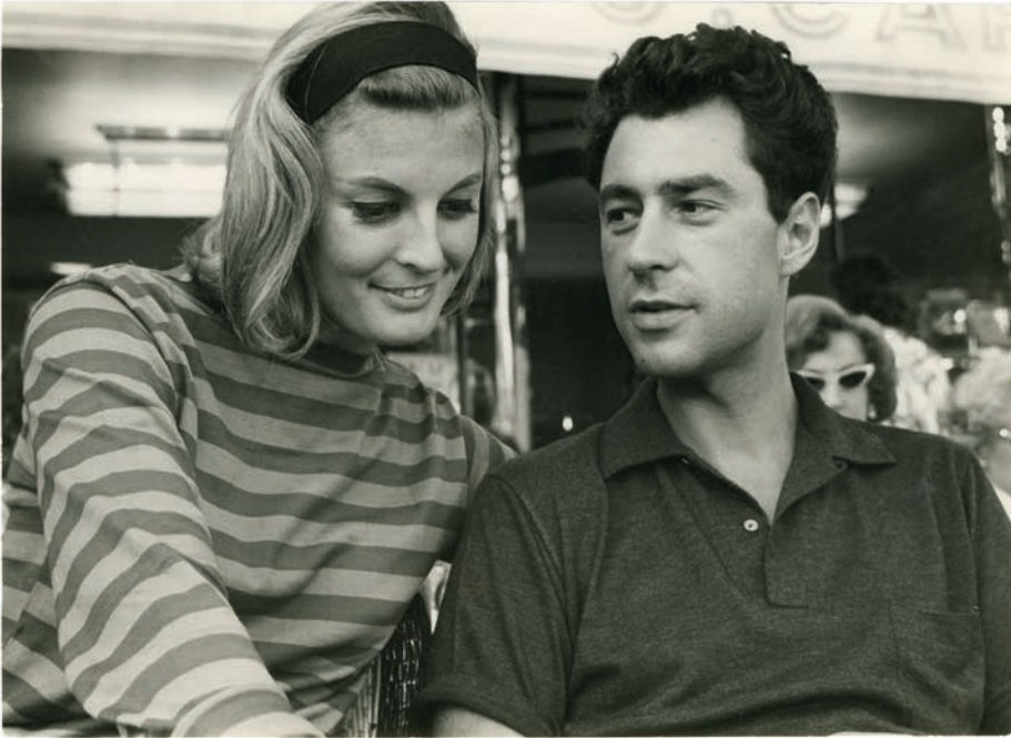
EE & OO in Paris

für diesen Mann? Einerseits will ich ungebunden sein und wäre froh, wenn seine Beziehung zu seiner Frau wieder in Ordnung wäre. Andererseits vermisse ich ihn und bin furchtbar gern mit ihm. Verliebt zu sein ist so belebend. Aber bin ich verliebt? EE ist ein stiller Mensch. Seine Präsenz war um so stärker, je schweigsamer er war. Wo andere durch lautes Benehmen auffielen, fiel EE durch seine Zurückhaltung auf. Seine sanfte Art und aufrichtige Zuneigung hatten etwas überaus Einnehmendes. Und sein hinkender, leicht schleppender Gang rührte mich und reizte mich, sein schweres Zeug für ihn zu tragen. Andere taten es aber auch. Nur seine Leica-Tasche trug er immer selber an der leicht herabhängenden linken Schulter. Seine M3 aber trug er außerhalb der Tasche, veränderte je nach Lichtverhältnis die Blende, ohne drauf zu schauen, immer bereit für den schnellen Klick. Manchmal schien er den richtigen Moment zu erahnen, und das perfekte Bild flog ihm regelrecht zu. Durch die enge Zusammenarbeit mit ihm habe ich das Sehen gelernt, Dinge, an denen man sonst leicht vorbeigeht, Formen, Licht, Leben, Momente. EE sagte, ein Photo ist dann gut, wenn es dir hilft, etwas zu sehen, was du nicht gesehen hast.