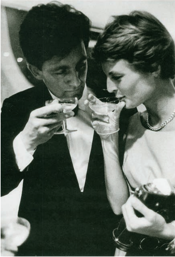
Feier zur Einweihung der neuen Hauptstadt, April 1960