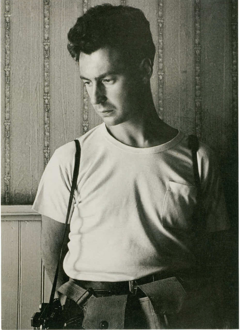
Elliott Erwitt, 1958