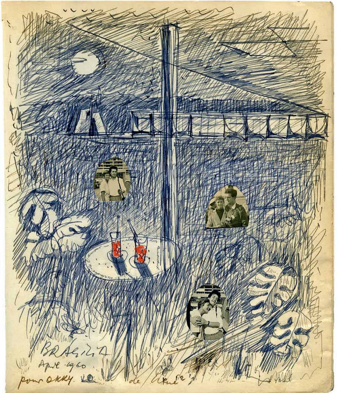
Zeichnung von René Burri, Brasilia, April 1960