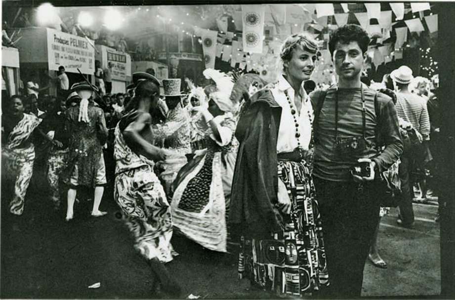
Erstes gemeinsames Photo, Rio, 1961

immer interessant, da gibt es einen regen Austausch von Erlebnissen und Erfahrungen. Ich merkte, daß EE's aufmerksamer Blick immer knapp an mir vorbei ging, das war sein Trick, unbemerkt jemanden ins Visier zu nehmen. Natürlich hatte er stets seine „treue Braut“, die Leica M3, dabei.