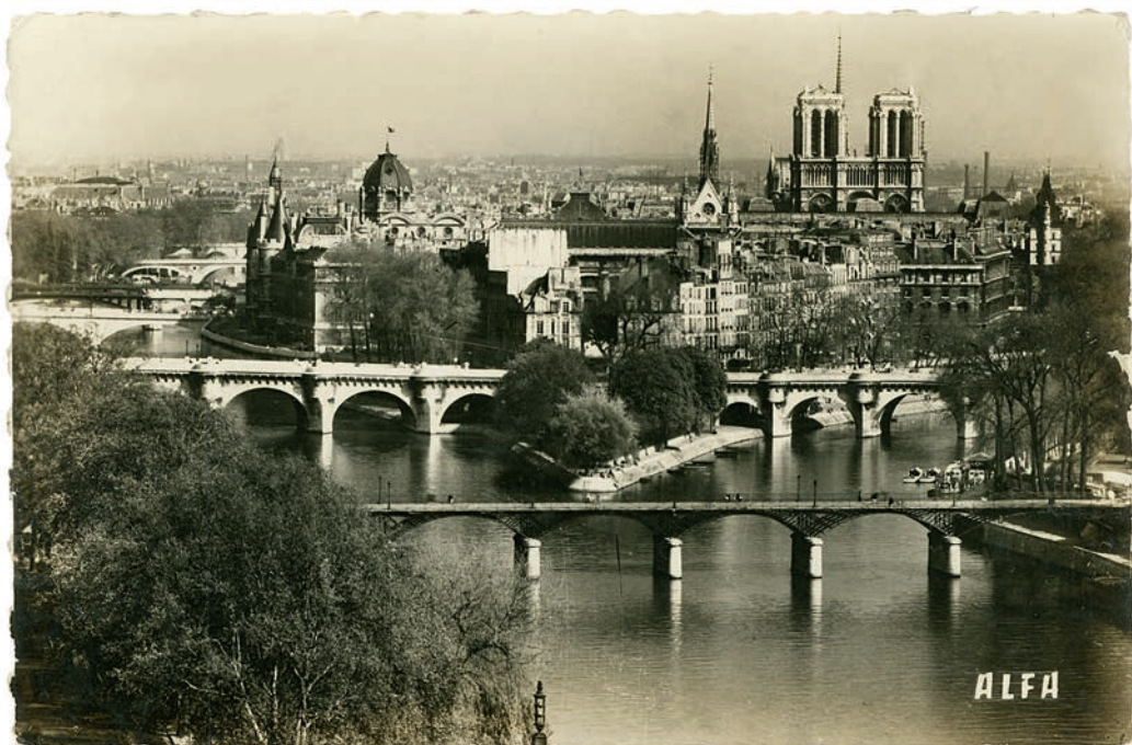
Ansicht von Paris, 1960