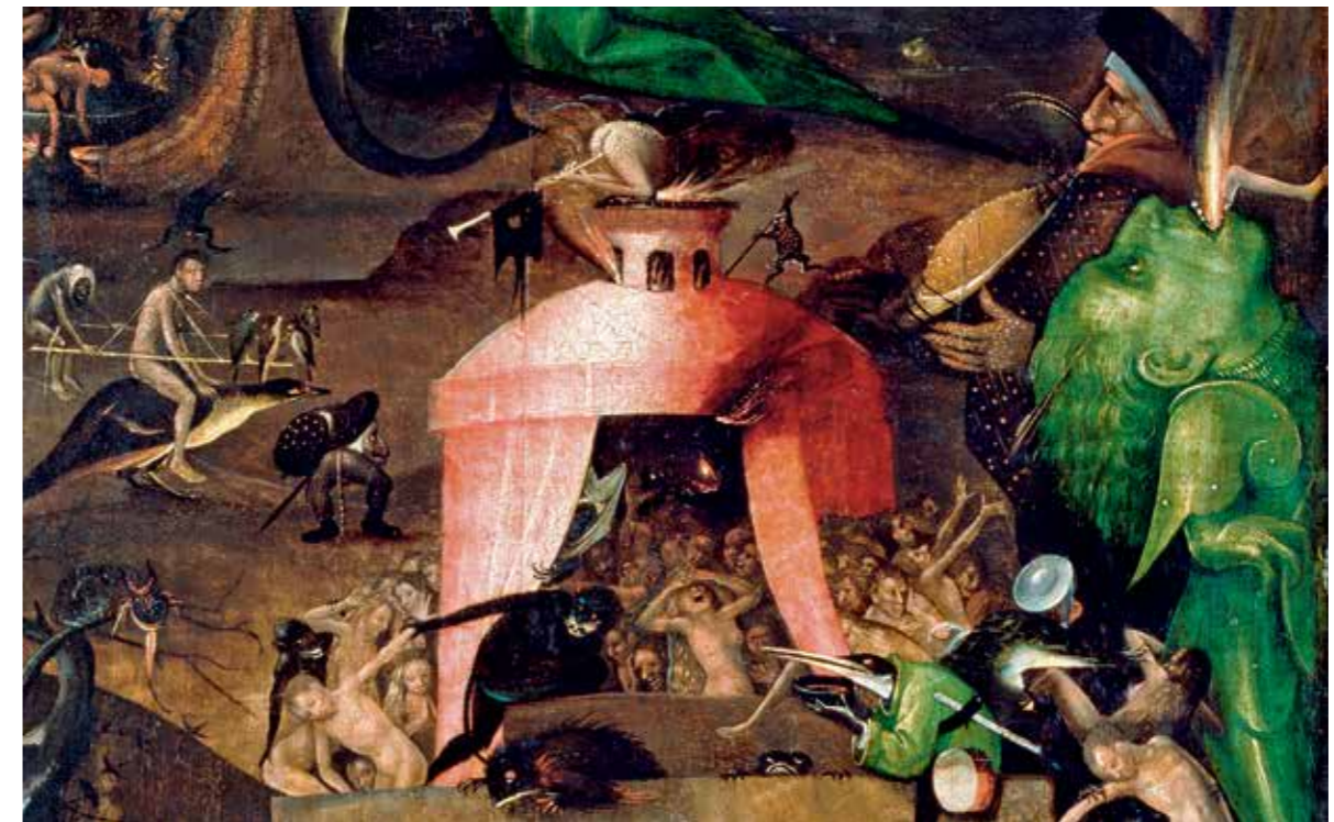
38 Detail vom rechten Flügel. Bosch's Phantasie und sein Erfindungsreichtum scheinen unerschöpflich. Bei genauer Betrachtung lassen sich immer wieder neue Figuren und Handlungen entdecken. Sie laden zum Nachdenken darüber ein, welche Vergehen die leidenden Sünder in ihre missliche Lage gebracht haben.