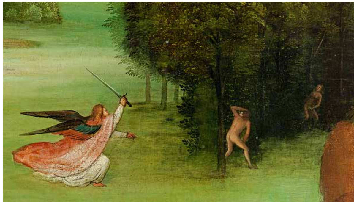
29 Die Vertreibung aus dem Paradies (Gen 3, 24), Detail vom linken Flügel