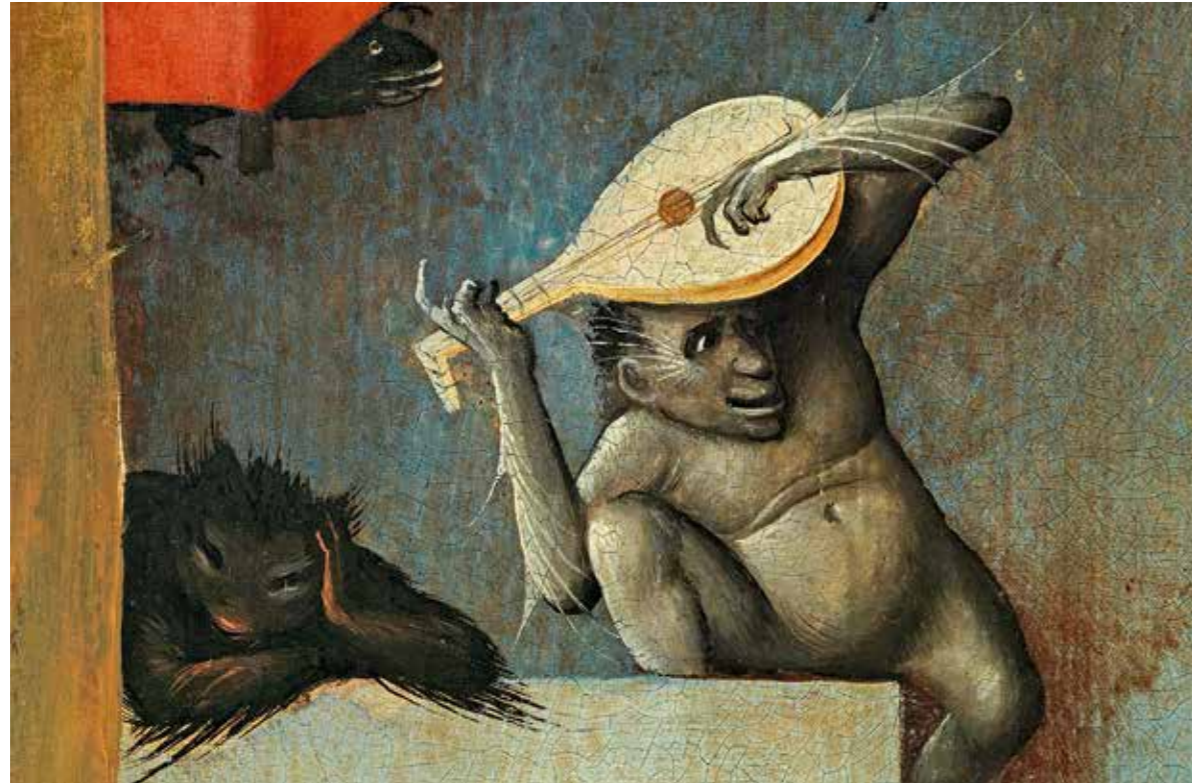
31 Zwei tierische Höllenteufel, Detail aus der Mitteltafel