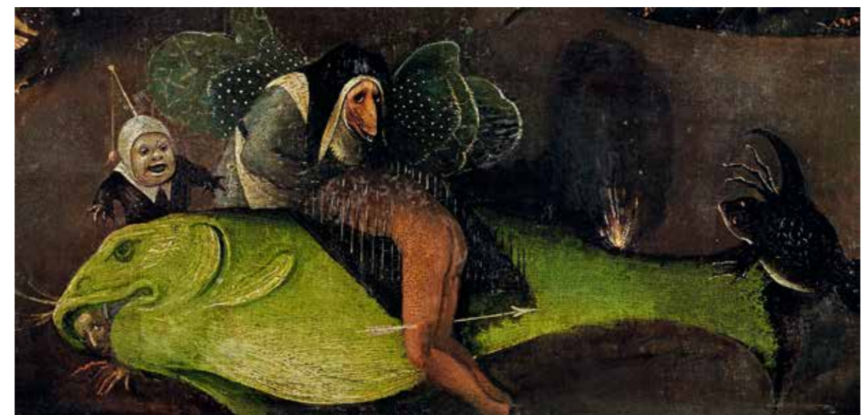
41 Folter auf dem Nagelbrett, Detail vom rechten Flügel