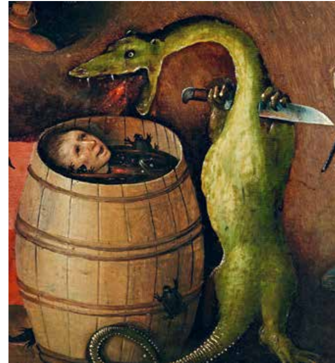
33 Verdammter im Weinfass, Detail aus der Mitteltafel