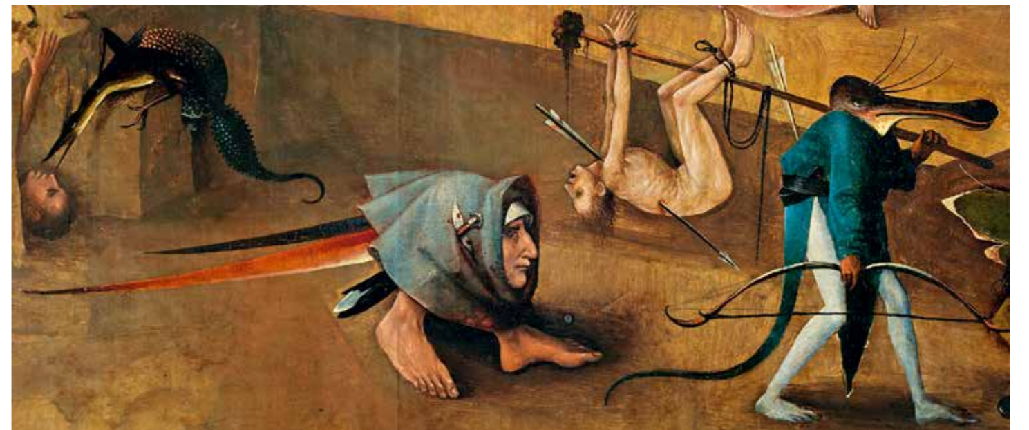
35 Ein Kopffüßler und ein Löffelreiherteufel, der einen Verdammten als Jagdbeute mit sich trägt, Detail aus der Mitteltafel