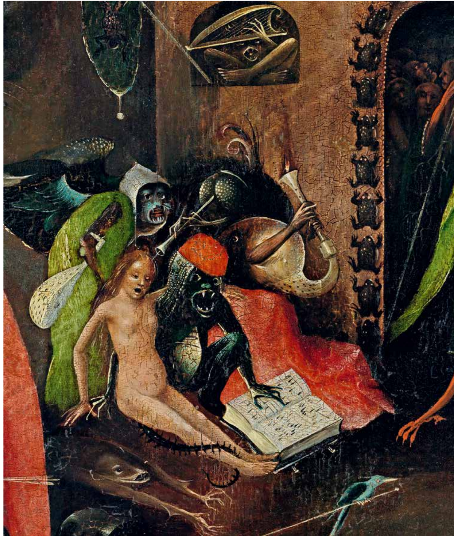
39 Höllenmusik, Detail vom rechten Flügel