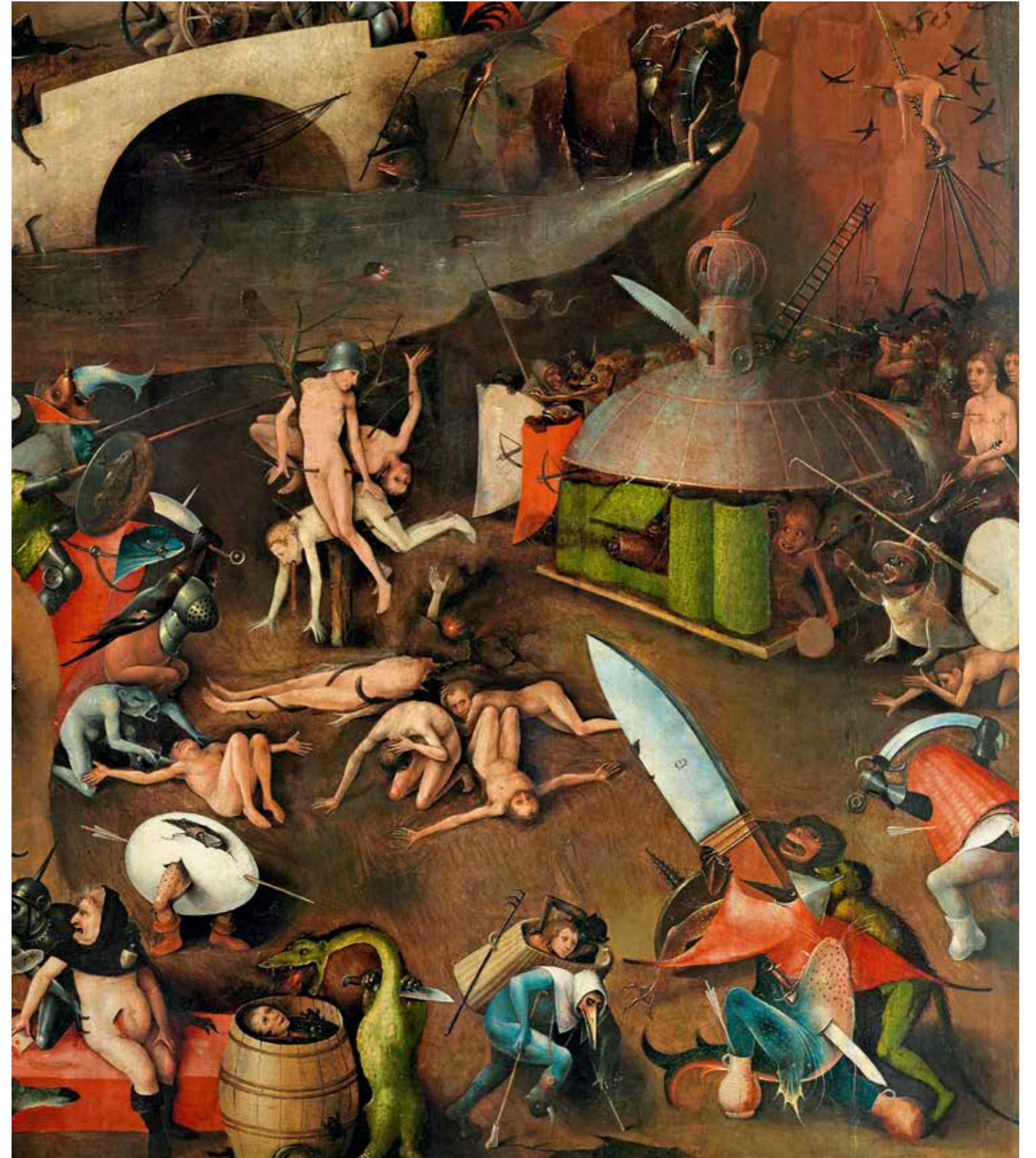
30 Höllenstrafen, Detail aus der Mitteltafel. Bei ihren Höllenstrafen bedienen sich die dämonischen Folterknechte auch alltäglicher Gegenstände, wie etwa eines Messers, auf dem man die Schmiedemarke B erkennt, wie sie in Den Bosch hergestellte Messer tatsächlich trugen. Dreht man den Buchstaben, kann man ihn auch als »m« für »miserere« (erbarmen) lesen.