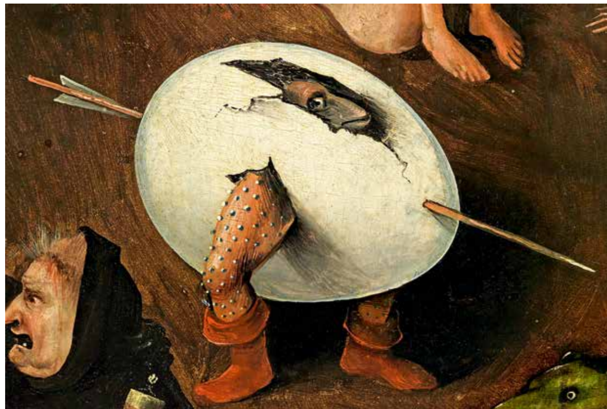
32 Ein Mischwesen aus Dämon und Ei, Detail aus der Mitteltafel. Der durchbohrende Pfeil ist ein von Bosch häufig gebrauchtes Symbol für das Böse und Sündige. Die oben aufgebrochene Schale erinnert an spätere Darstellungen mit Narren im Ei.