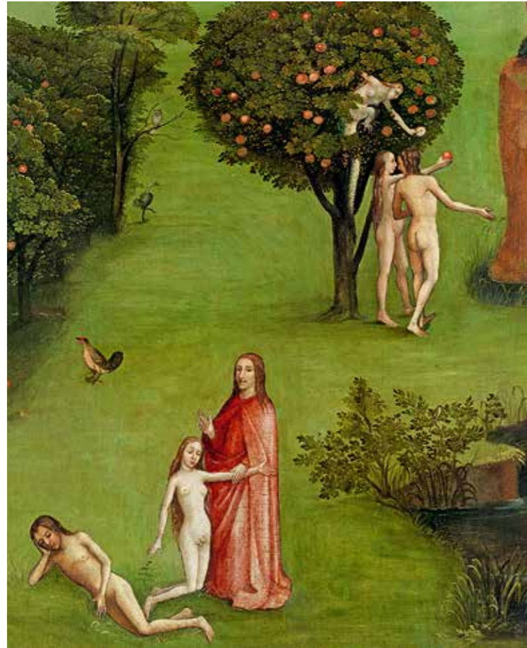
28 Die Erschaffung Evas und die Versuchung am Baum der Erkenntnis (Gen 2, 22 und Gen 3, 1), Detail vom linken Flügel