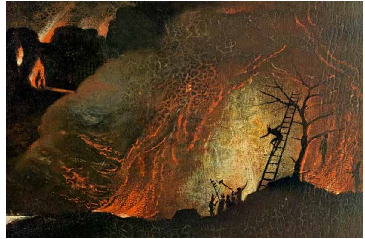
37 Strafvollzug in nächtlicher Brandlandschaft, Detail vom rechten Flügel