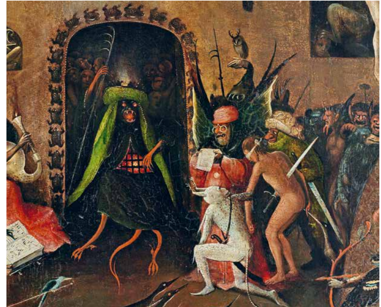
40 Ein höllisches Strafgericht, Detail vom rechten Flügel