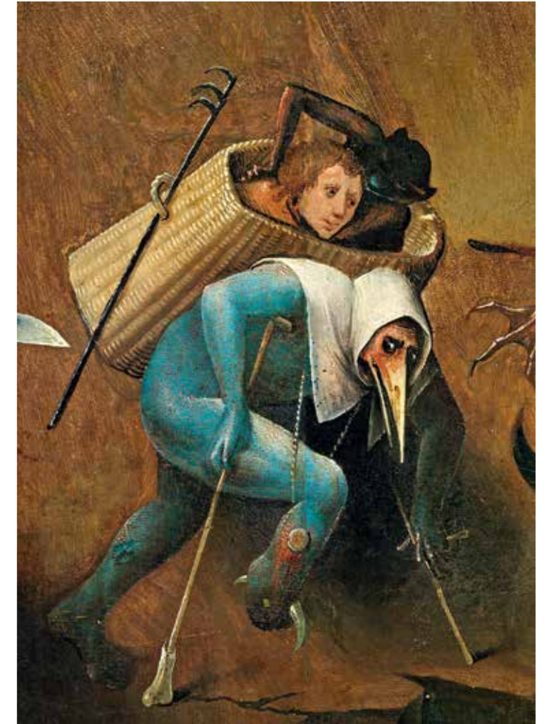
34 Ein teuflischer Hausierer, Detail aus der Mitteltafel. Eine Anspielung auf fahrende Bettler, die zu Boschs Zeit als Plage galten.