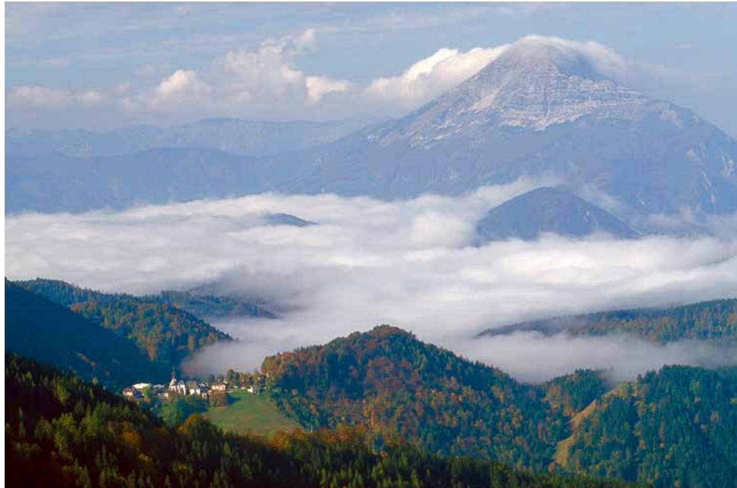
Annaberg und der Ötscher – eine enge Beziehung

Seite 12/13: Blick aus der Pfarrkirche zum Ötscher, um 1930