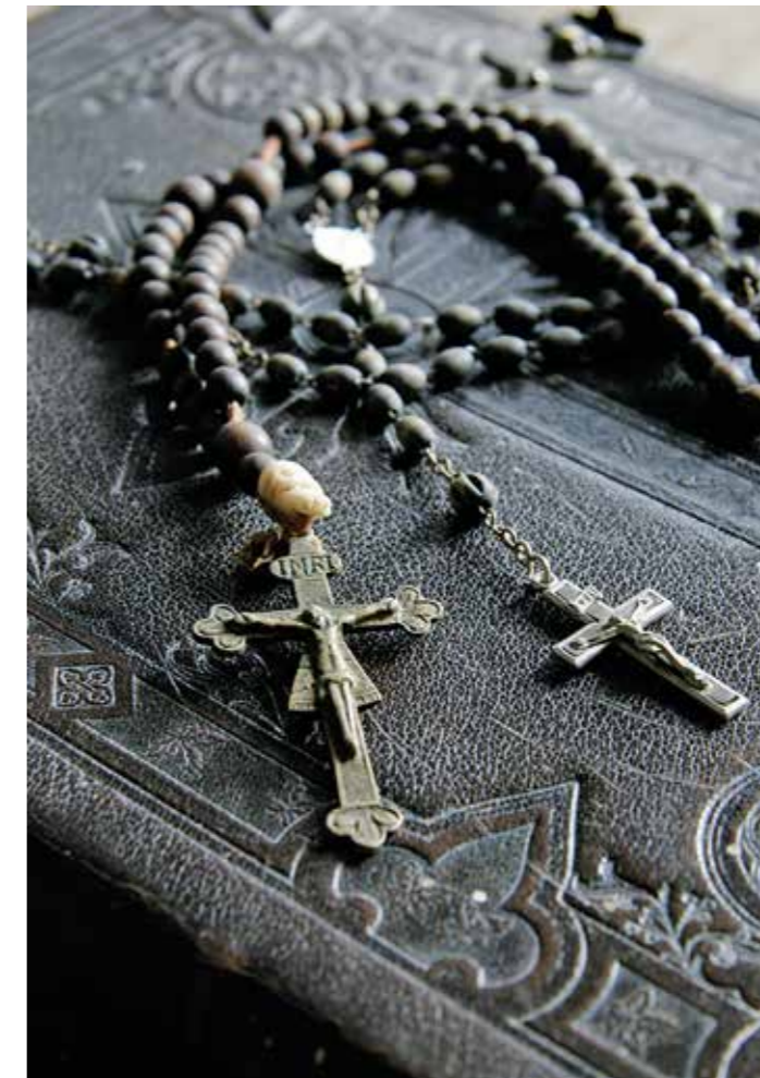
Annaberg, ein heiliger Ort