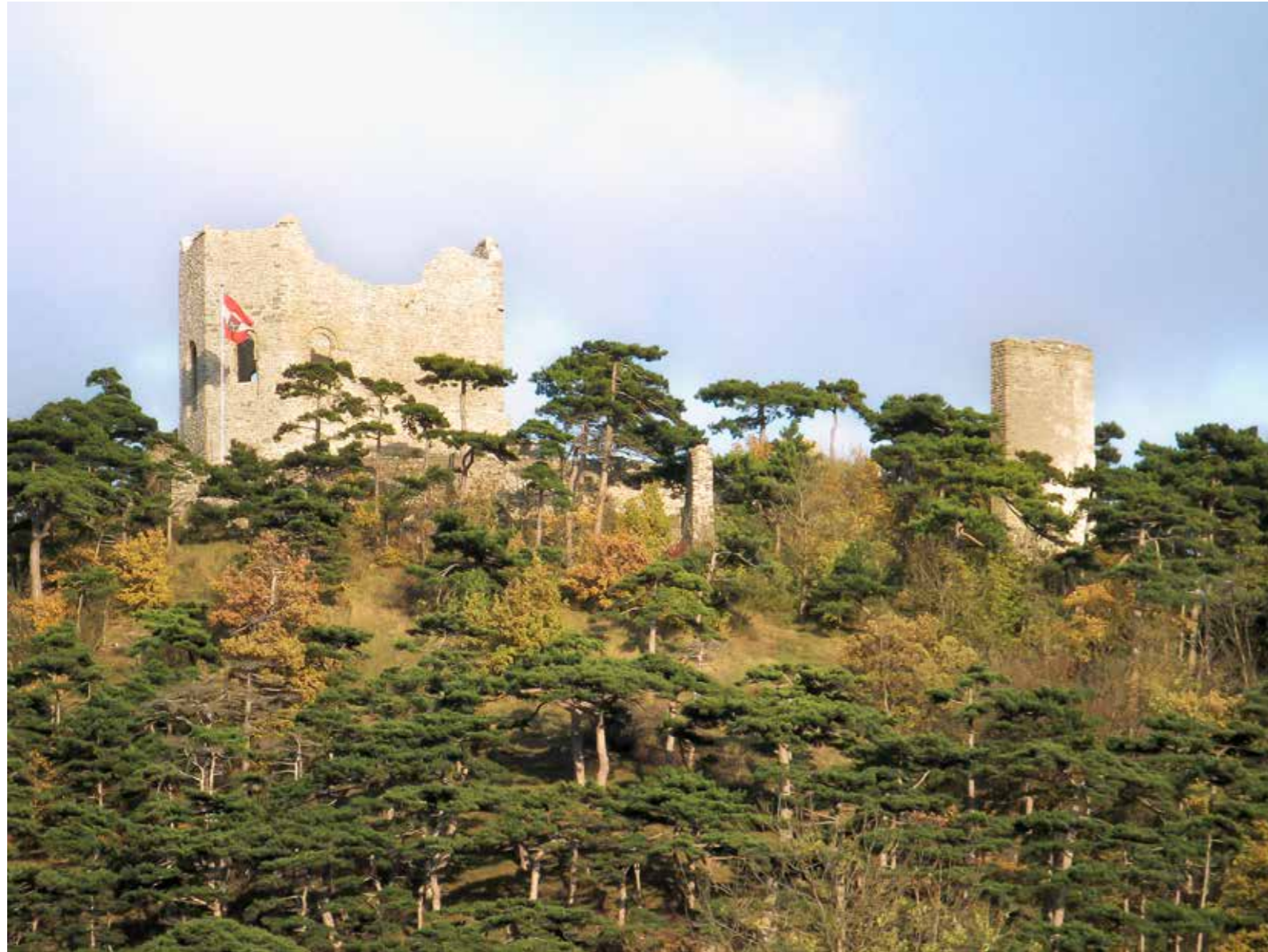
Ansicht der Burgruine von Norden (von der Meiereiwiese) heute, rechts der Zugang vom Halsgraben (nicht sichtbar) vorbei am Turm.