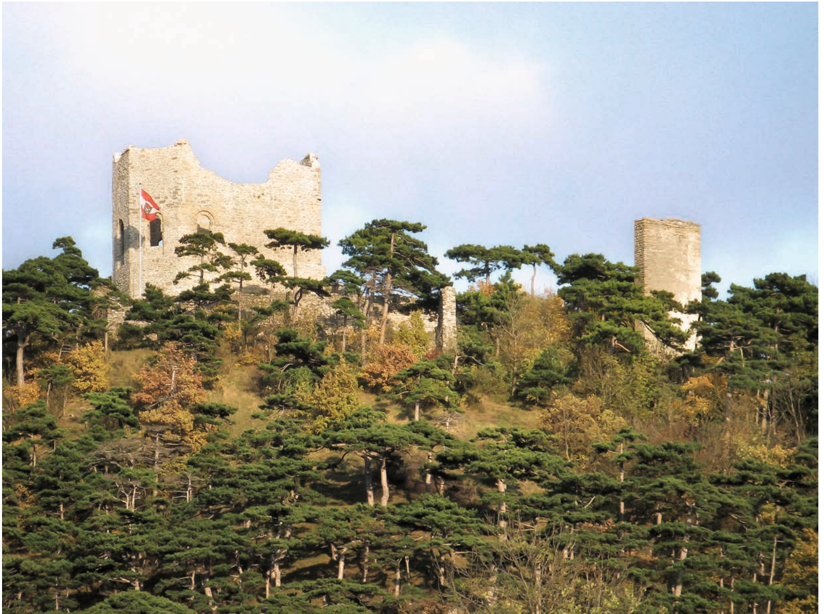
Ansicht der Burgruine von Norden (von der Meiereiwiese) heute, rechts der Zugang vom Halsgraben (nicht sichtbar) vorbei am Turm.