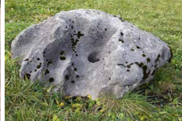
Abb. 17: Auf dem Hahnberg bei Röschütz (NÖ): flache, deutlich von prähistorischer Hand in Granitgestein eingeriebene Schälchen. Verdeutlichung der Schalenränder durch Kreidemarkierung.