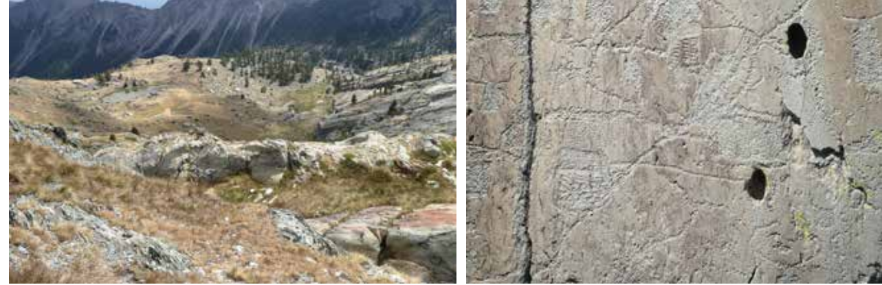
Abb. 11: Sicht von den verbotenen Kultbilder-Felsen am Voie Sacrée (heiliger Weg) auf den Bergsee Lac Vert im Fontanalbe-Tal (F). In den westl. Voralpen Frankreichs und Italiens verzahnen sich mediterrane und hochalpine Tier- und Pflanzenwelt. Genauso erlebt man auf der Höhe zwischen 2.000 und 2.700 m die neolithisch-bronzezeitliche Gestaltung der Felsen als Ineinandergreifen von Motiven einer religiös gedachten Kulturlandschaft. Abb. 12: Felsbild im Tal der weißen Quelle (F): Auswitterungslöcher, die von prähistorischer Hand durch Kanäle mit Feldsymbolen vernetzt worden sind. Skorpion-Stiere könnten auf die damals zur Sommersonnwende im Sternbild Skorpion stehende Sonne Bezug nehmen oder aber auf einen ägyptischen Herrscher mit diesem Namen.