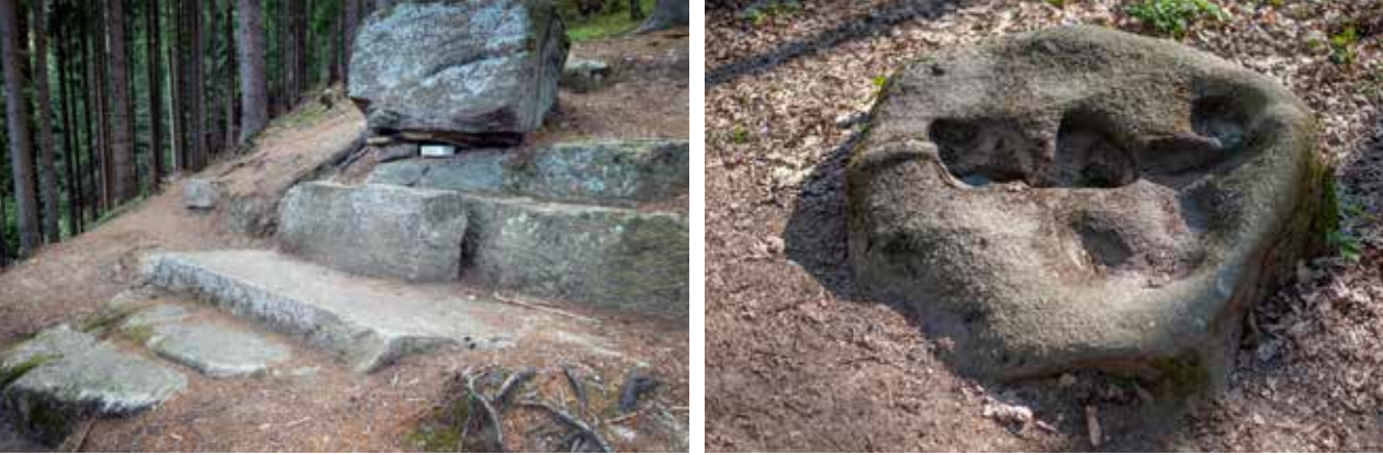
Abb. 21: Stadtgemeinde Kindberg (Steiermark, Bezirk Bruck an der Mur-Mürzzuschlag) – Der Kultstein: Ein liegender Kalenderstein unterhalb des Kultfelsens soll seinem Schattenwurf nach zur Wintersonnenwende hin ausgerichtet gewesen sein, denn an Sonnwenden fehlt der Schatten an der Frontseite zur Gänze. Der K. soll auch mit einem Menhir und einem Tumulus in Verbindung stehen. Vom K. weg führt kilometerlang ein geschwungenes Erdwerk ins Mürztal.