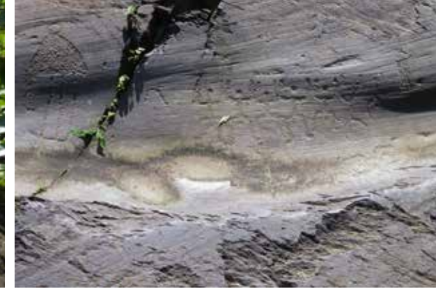
Abb. 5: Parco Nazionale delle Incisioni Rupestri loc. Naquane (I): natürlich entstandene periglaziale Strudel-löcher in einer Sandsteinbank (su concessione del Ministero per i Beniculturali Direz. Reg. Musei Lombardia) Abb. 6: Archeoparc Naquane, Capo di Ponte (I): eine glazialgenetische Wanne mit dem bronzezeitlichen Felsbild von einer Totenwache (su concessione del Ministero per i Beniculturali Direz. Reg. Musei Lombardia)

Sobald Schälchen verdichtet auftreten und sich in Mustern anordnen, wenn sich Cup- and Rings bilden oder wenn Schälchen durch Rinnen verbunden sind, gilt als Entstehungszeit die jüngere Bronzezeit.