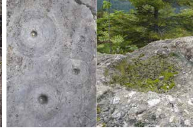
Abb. 7 und 8: Der Tatzelbrunn bei Königswiesen (O.Ö.): eine von Menschenhand ausgeriebene runde (Opfer-?) Schale mit dem Felsbild „Tierspur“ im Zentrum einer glazialbedingt entstandenen Wanne, außen ein (mit Steinen) grob zurechtgebauner Rand in Bootsform. Vergleichbar mit der 1,5 m breiten Opferschale von Prackenbach/Regen (D)

Doch sie sind nicht rund, sondern nierenförmig und sie haben scharfe Ränder. Im Gegensatz zu Vergleichslöchern im Valcamonica wurden diese natürlichen Löcher im Tal der Wunder und im Tal der weißen Quelle bereits vor mindestens 3.000-5.000 Jahren in Felsritzbildern miteinbezogen, indem sie als Zisternen interpretiert und durch Kerblinien-Kanäle mit Feld-Symbolen vernetzt wurden, damit die Felder symbolisch Wasser (Fruchtbarkeit) erhielten. Seither haben sich die Löcher nicht verändert, sind nicht rundlicher geworden, andernfalls wären dadurch Felsbildmotive zerstört worden.