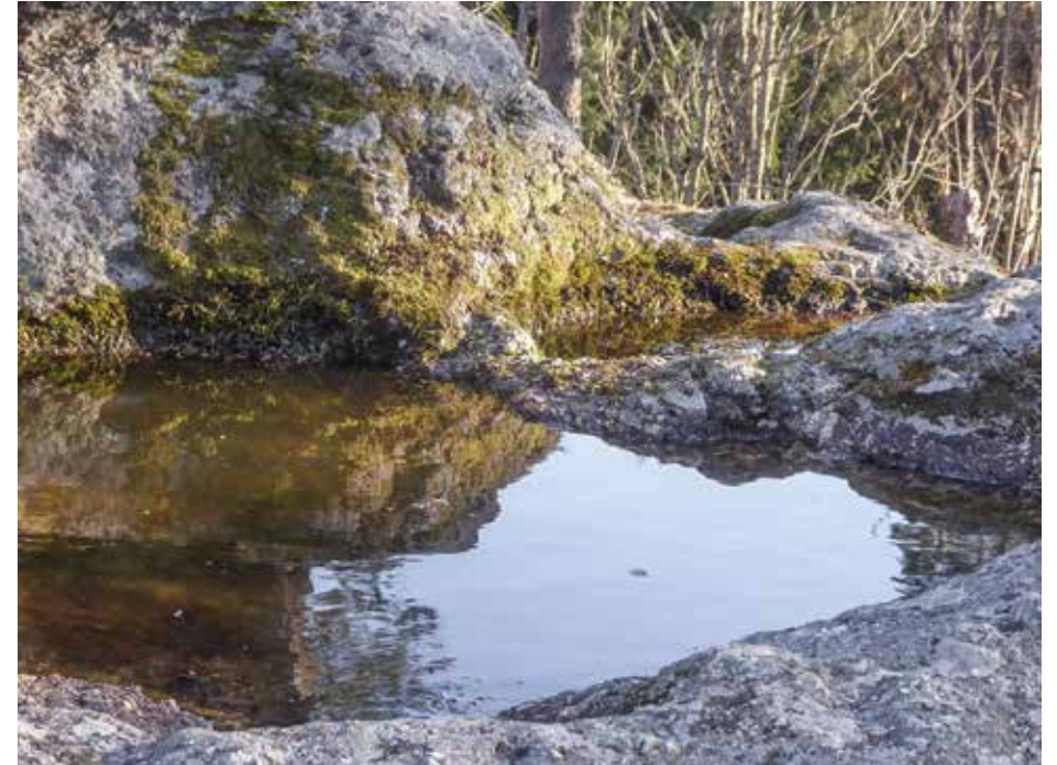
Abb. 1: Eibenstein (OÖ.): das 4 Schalen-Wasserheiligtum Heidenstein aus zumindest teilweise von prähistorischer Menschenhand gebauenen Schalen mit entsprechend rauen Rändern. Alles Leben kommt aus dem Wasser.

„In einer Schale die Welt finden“ Kakuzo Okakura