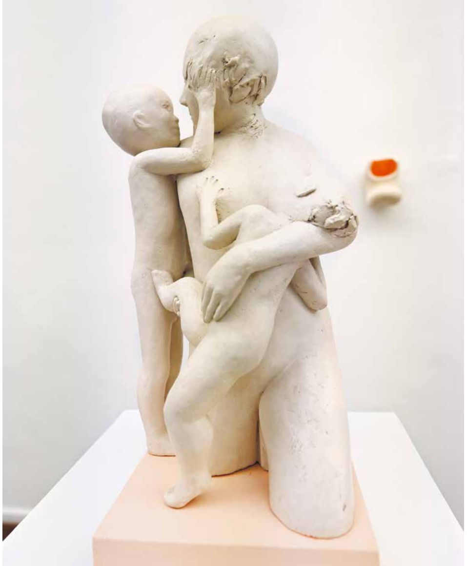
„lieb und gern“ (2008) (Abb. S. 119, vorne)