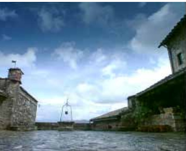
Sacro Speco di San Francesco, Umbrien

Es ist immer gut, daran zu denken, dass Gebet den Anfang, die Mitte und das Ende unserer Tätigkeiten segnen kann. Im Anfang zum Beispiel am Morgen, ein kurzer Augenblick, wo wir den Tag vorwegnehmen, den Tag weihen, vor dem Essen einen Augenblick, vor der Arbeit einen Augenblick stillhalten, die künftige Tätigkeit einfach in das Licht Gottes aufheben. In der Mitte, sehr wichtig, auch immer wieder unterbrechen, auch nur einen Augenblick lang, die Tätigkeit zu unterbrechen, und uns darauf zu besinnen, was tun wir hier eigentlich, was ist der Sinn von dem Ganzen. Und am Ende noch einmal zu überschauen, am Tagesende oder am Ende einer gewissen Tätigkeit, am Ende der Mahlzeit, Dank sagen. Am Ende einer Begegnung, zusammen mit dem Verabschieden, einen Augenblick diese Begegnung und alles, was drinnen gelegen ist, in das Licht Gottes aufheben. Diese drei Teile: Anfang, Mitte und Ende, so durch Gebet zu weihen.