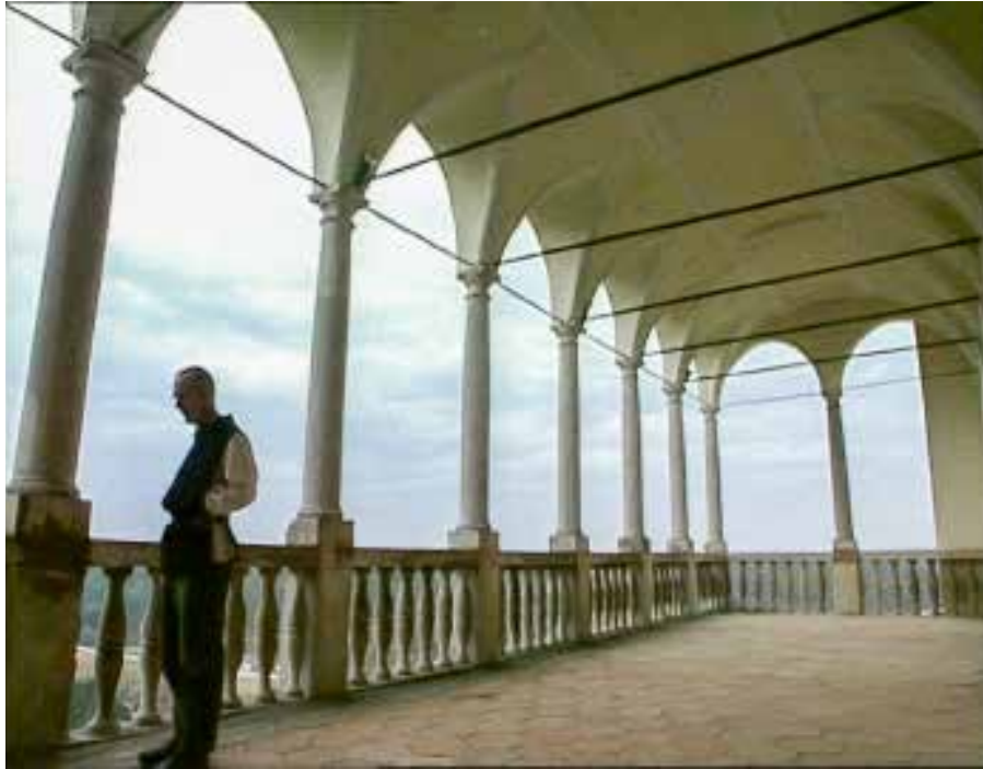
Loggia, Schloss Rosenberg

Das Schönste am Beten ist eigentlich das Segnen und das lässt sich so wunderbar in den Alltag einbauen. Jederzeit können wir segnen, jeden Augenblick empfangen wir Gottes Segen, wenn wir uns nur dessen bewusst werden. Jeder Atemzug ist ein Empfang des Segens – wer sagt uns denn, dass wir noch weiteratmen können, das hat uns ja niemand versprochen. Jeder Atemzug ist ein neues Geschenk. Und diesen Segen zu empfangen und auszustrahlen, weiterzugeben, zurückzugeben, das ist eigentlich das Schönste am Leben, das ist die Teilnahme am göttlichen Leben.