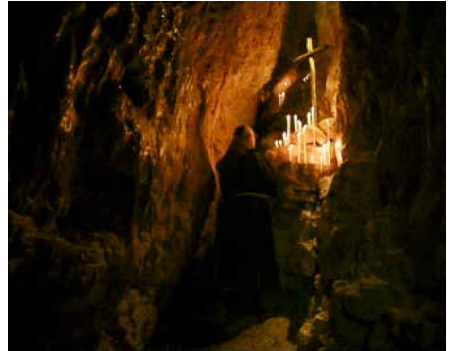
Sacro Speco di San Francesco, Umbrien

Eine Form, in der viele Menschen täglich und stündlich beten, ist das Herzensgebet. Und das ist nicht so sehr ein Gebet, das man spricht, obwohl die klassische Form des Herzensgebetes, die Wiederholung des Namens Jesu, schon dafür typisch ist. Aber eigentlich handelt es sich nicht so sehr um Gebete, sondern um eine Gebetshaltung beim Herzensgebet, um eine Achtsamkeit des Herzens, nachdem beim Beten das Entscheidende die Achtsamkeit ist. Wenn wir nicht mit Achtsamkeit beten, dann ist es nur ein Herunterleiern und kein wirkliches Beten. So macht die Achtsamkeit alles, was wir tun zum Gebet. Wenn wir immer die Augen des Herzens am Horizont halten, in allem, was wir tun, dann wird alles zum Gebet, dann wird unser ganzer Alltag zum Gebet. Das ist ja eigentlich die Aufgabe, ohne Unterlass zu beten, nicht nur hie und da Gebete zu sagen.