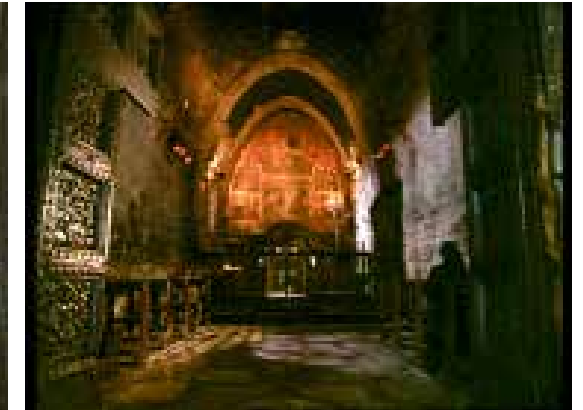
Portiuncula Kapelle, Assisi

Gebet ist ja in erster Linie nicht etwas, was wir tun, sondern etwas, in das wir eintreten, wie wir in einen Raum eintreten. Wie man zum Beispiel in diesen Raum des Gebetes hier eintritt. Zunächst ist da das Gebäude, die Wände, das Gewölbe, die Bilder, die uns ansprechen. Ein Wort, das uns anspricht. Aber wenn wir uns ansprechen lassen, dann bemerken wir, dass wir von einer Stille, von einem Schweigen ganz geheimnisvoll angesprochen werden, denn das Wesentliche an diesem Raum ist die Stille. Und in dieser Stille begegnen wir einer geheimnisvollen Gegenwart. Wir erleben, was wir die Gegenwart Gottes nennen könnten. Etwas, was uns geheimnisvoll entgegenkommt, auf uns wartet, was etwas von uns erwartet. In jedem Augenblick erwartet diese Gegenwart etwas von uns, und indem wir antworten, verstehen wir. Erst im Tun, im liebenden Antworten verstehen wir, worum es dabei geht. Und das sind die drei Bereiche: Wort, Schweigen und Verstehen. Ganze Welten des Gebetes. Und das hängt ja auch zusammen mit dem, was Christen die Dreieinigkeit Gottes nennen. Denn einerseits sprechen wir von Gott, dem Urgrund des Seins, den Abgrund des Schweigens, aus dem das Wort geboren wird, das ewige Wort, das immer neu die Liebe Gottes ausdrückt und ausspricht. Und indem wir uns diesem Wort stellen und darauf antworten, verstehen wir. Man könnte fast sagen, dass Beten das Spiel Gottes, der Reigentanz Gottes sei, in das wir als Menschen eintreten, eingebettet sind, mitschwingen, mittanzen.