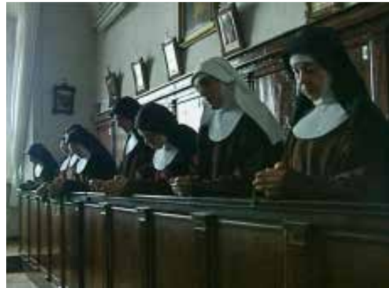
Klarissenkloster Santa Croce, Assisi

Eltern sterben, wir eine neue und viel engere Beziehung zu ihnen haben als vorher. Diese Beziehung können wir ausnützen, auf die können wir uns stützen. Und so können wir einfach den anderen Menschen im Herzen halten und im Herzen Gott hinhalten. Wenn zwei Menschen einmal einander wirklich ganz eng nahegekommen sind, dann lässt sich das nie mehr trennen. Ich stell mir das so vor, dass für immer und ewig sie einander irgendwo nah bleiben und irgendwie in Verbindung bleiben, auch wenn sie einander schon fast vergessen haben. Oder wenn sie einander auch vergessen haben und einer noch an den anderen denkt, kann man immer noch dem Anderen nah bleiben und kann dann den Anderen im Herzen zur Quelle des Lebens hinhalten. Kann den Anderen Gott hinhalten. Und das ist, für jemanden zu beten, und das hilft, das wissen wir aus Erfahrung, das können wir erproben.