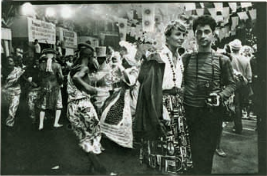
Erstes gemeinsames Photo, Rio, 1961

immer interessant, da gibt es einen regen Austausch von Erlebnissen und Erfahrungen. Ich merkte, daß EE's aufmerksamer Blick immer knapp an mir vorbei ging, das war sein Trick, unbemerkt jemanden ins Visier zu nehmen. Natürlich hatte er stets seine „treue Braut“, die Leica M3, dabei.