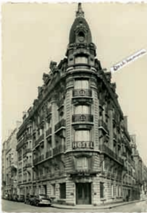
Postkarte. Hotel Cecil, Rue St. Didier / Rue Lauriston, Paris XVI, 1961