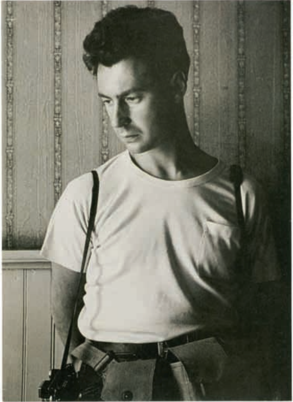
Elliott Erwitt, 1958