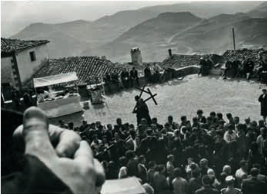
Unterwegs in Spanien

EE wird arbeiten, ich will ihm helfen oder einfach dabeisein. Arkady fasziniert mich auch, er hat viele gute Eigenschaften und ist ein eleganter Mann von Welt, kultiviert und mit guten Manieren. Aber ich fliege nach Europa, um meinen Meister zu treffen, einfach weil unsere Seelen nach einander verlangen. EE ist zwar verheiratet und hat vier Kinder, aber das bedeutet mir nichts, ich gehöre nicht zu seinem normalen Leben. Und diese kommenden zwei Wochen sind nichts anderes als zwei Wochen fern der bekannten Augen und Zungen. Nichts vorher und nichts nachher, dachte ich. Und was später kommt, wird bestimmt nicht gut. Also wozu jetzt daran denken.