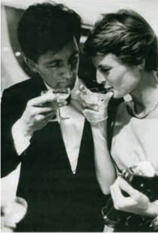
Feier zur Einweihung der neuen Hauptstadt, April 1960