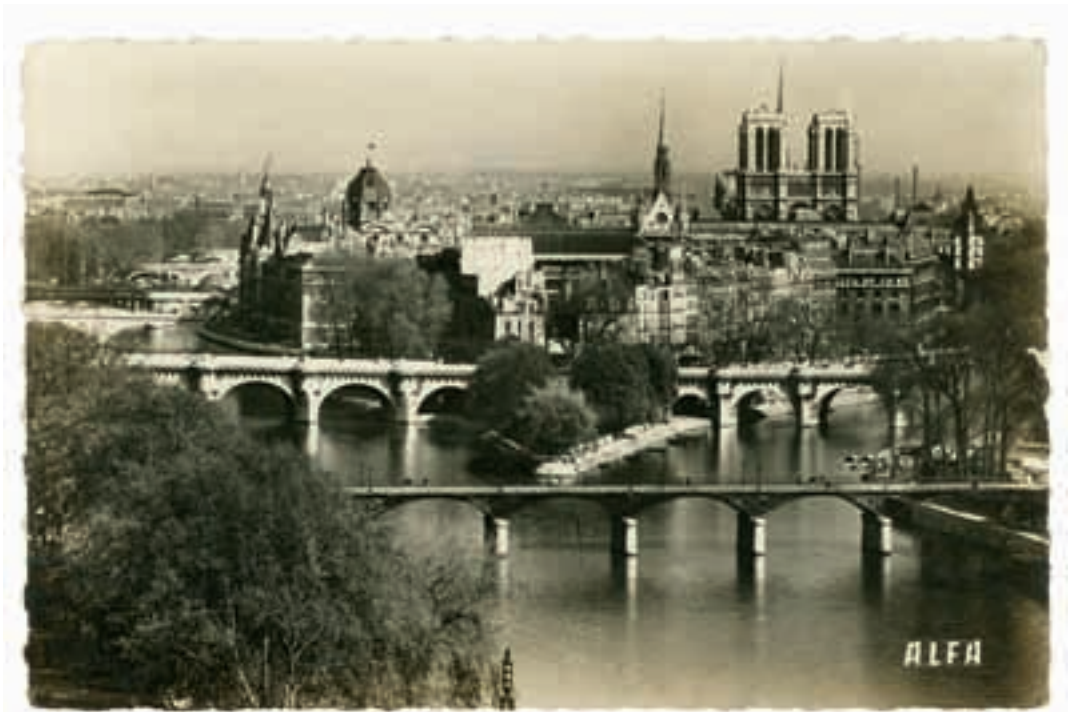
Ansicht von Paris, 1960