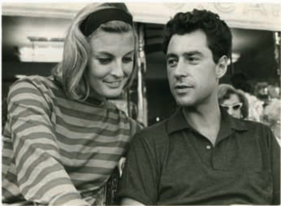
EE & OO in Paris

für diesen Mann? Einerseits will ich ungebunden sein und wäre froh, wenn seine Beziehung zu seiner Frau wieder in Ordnung wäre. Andererseits vermisse ich ihn und bin furchtbar gern mit ihm. Verliebt zu sein ist so belebend. Aber bin ich verliebt? EE ist ein stiller Mensch. Seine Präsenz war um so stärker, je schweigsamer er war. Wo andere durch lautes Benehmen auffielen, fiel EE durch seine Zurückhaltung auf. Seine sanfte Art und aufrichtige Zuneigung hatten etwas überaus Einnehmendes. Und sein hinkender, leicht schleppender Gang rührte mich und reizte mich, sein schweres Zeug für ihn zu tragen. Andere taten es aber auch. Nur seine Leica-Tasche trug er immer selber an der leicht herabhängenden linken Schulter. Seine M3 aber trug er außerhalb der Tasche, veränderte je nach Lichtverhältnis die Blende, ohne drauf zu schauen, immer bereit für den schnellen Klick. Manchmal schien er den richtigen Moment zu erahnen, und das perfekte Bild flog ihm regelrecht zu. Durch die enge Zusammenarbeit mit ihm habe ich das Sehen gelernt, Dinge, an denen man sonst leicht vorbeigeht, Formen, Licht, Leben, Momente. EE sagte, ein Photo ist dann gut, wenn es dir hilft, etwas zu sehen, was du nicht gesehen hast.