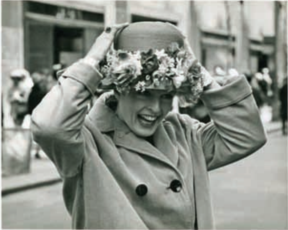
Easter Parade, New York