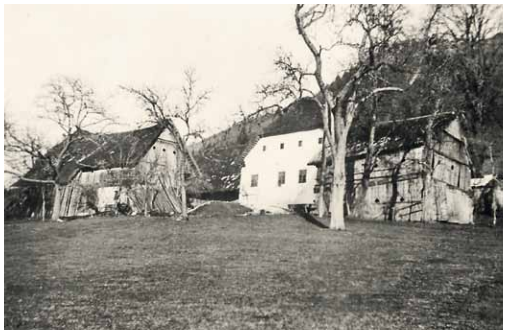
Alte Ansicht vom „Gschwendtbauern“