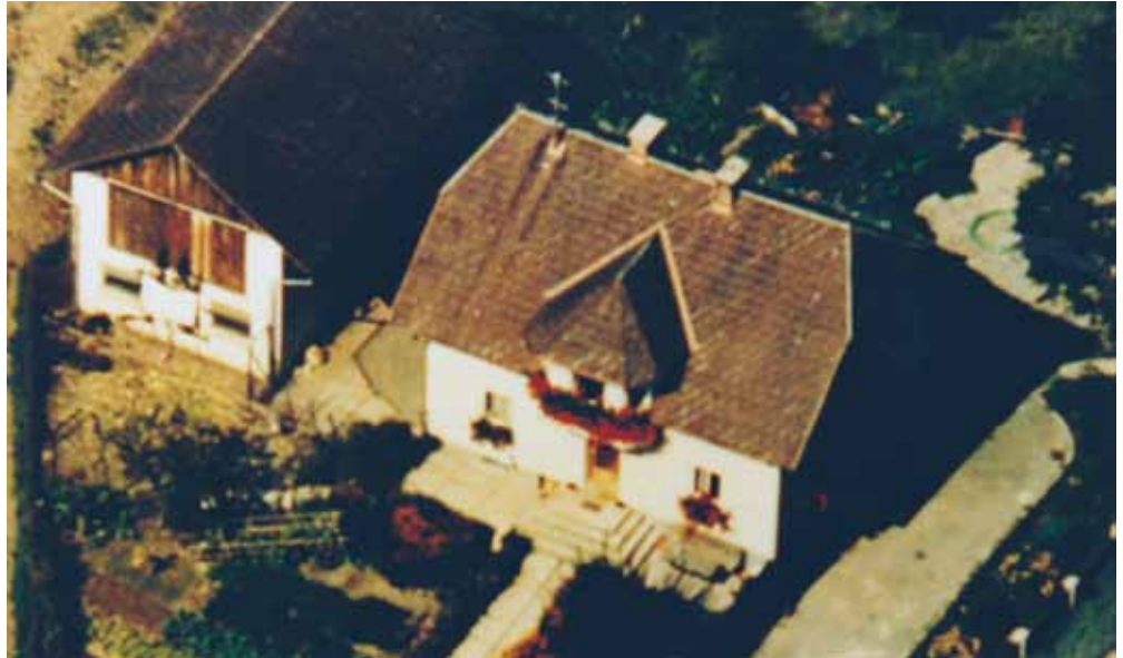
Das Haus im Jahre 1993