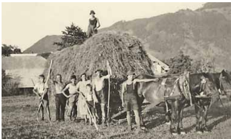
Heuernte, „Marbach“ im Jahr 1938