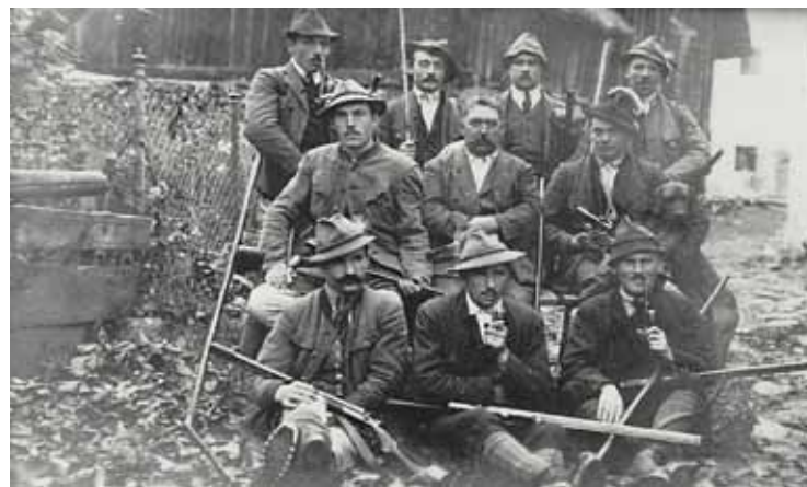
Jäger im „Marbach“ im Jahr 1928