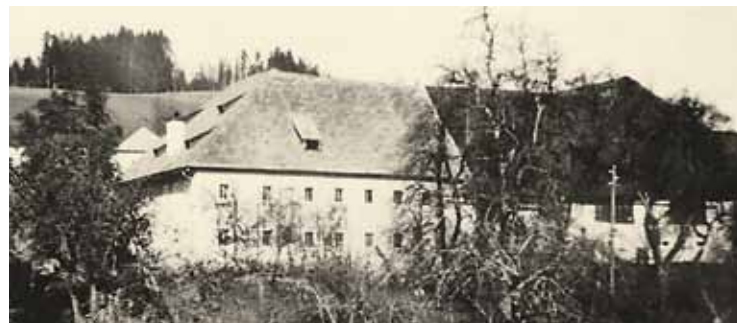
„Marbachgut“, um 1900