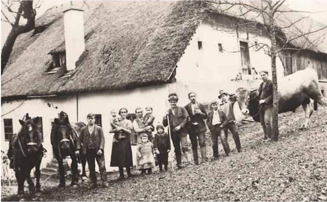
„Gschwendtbauer“ mit Familie und Gesinde , um 1900