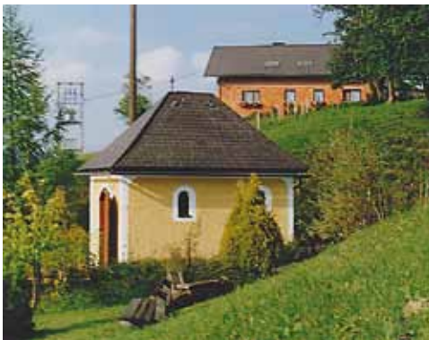
Die neue Kapelle auf der „Gschwendthöhe“ im September 1999