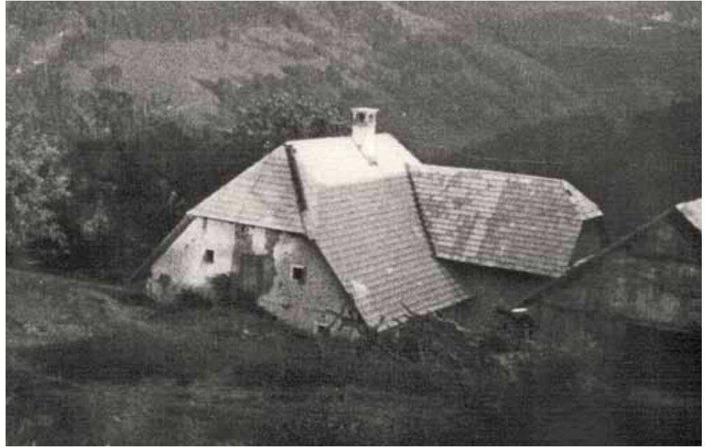
Das „Krottenberg“ mit Familie Kronsteiner. Das Bauernhaus wurde zur Gänze abgetragen.